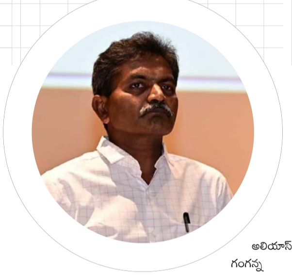
అలియాస్ గంగన్న ఉన్నారు.

దశాబ్దాల అజ్ఞాత జీవితానికి స్వస్తి : జగిత్యాల జిల్లా కోర్టు పట్టణానికి చెందిన తిప్పిరి తిరుపతి అలియాస్ - మగతా3లో